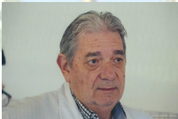
Carlos Soler Murillo, actual presidente de la Comisión Nacional de Jueces, durante la presidencia de Tomás Montiel Luis.