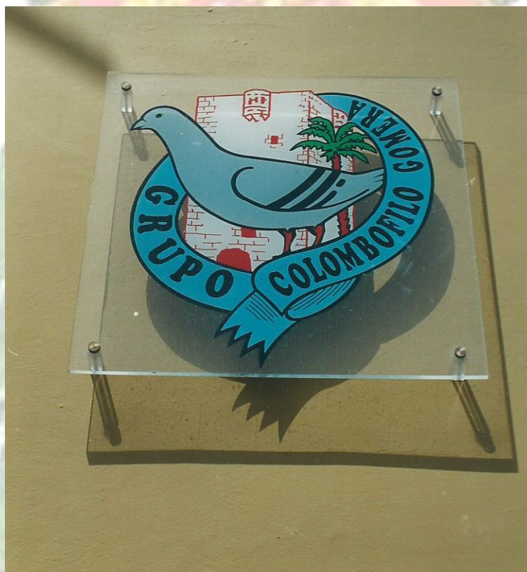
Logotipo oficial del Club Colombófilo Gomera, que se encuentra en la fachada de la sede social en San Sebastián de La Gomera.

Entre la cultura evolutiva de esta Isla, joya de la naturaleza, se vincula como uno de sus expresiones más apreciadas, la práctica de la colombofilia. Junto a su patrimonio natural, su legado histórico, su cultura, su lenguaje del silbo, su tradición agrícola, su gastronomía y su música de chácaras y tambor, entre otros aspectos tradicionales, conviven con armonía, afición y naturaleza, en medio de la tranquilidad y el sosiego.