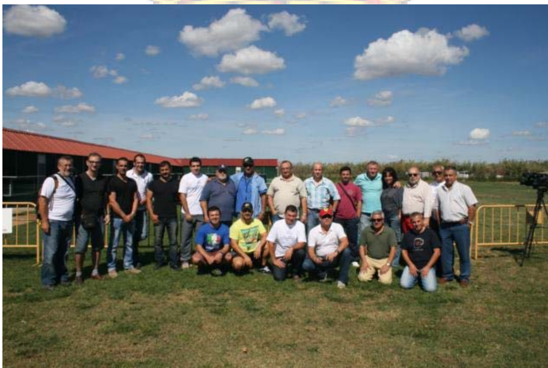
Colombófilos andaluces asistentes al Golden Race 2013.