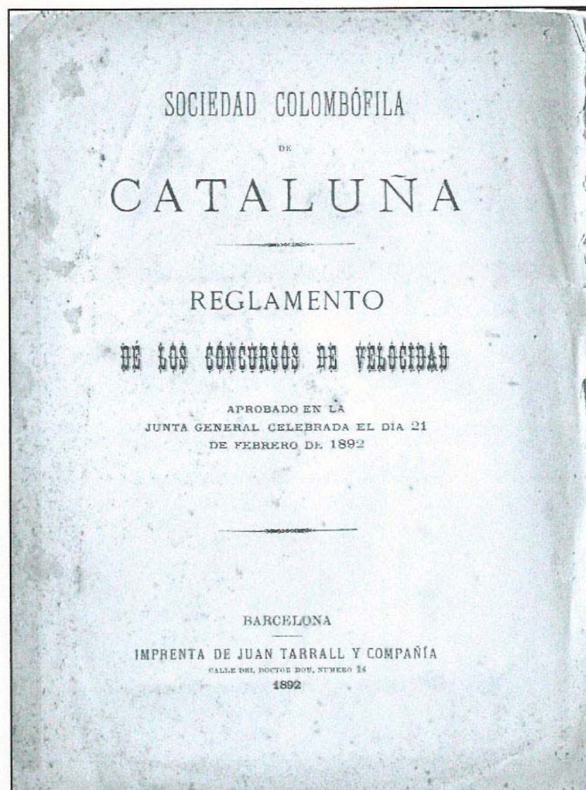
Portada Reglamento Concursos

La primera en independizarse fue la Sociedad Colombófila de Murcia, constituyéndose en sociedad propia, el día 8 de mayo de 1893.