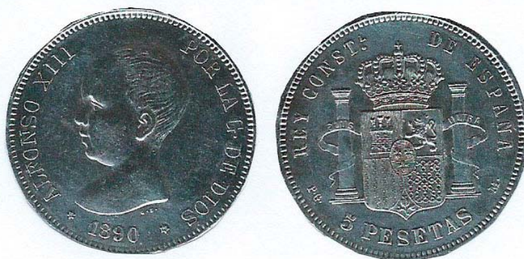
Moneda de 5 Ptas.

Para sufragar los gastos de fundación, se fija por socio, una cuota de 10,00 pesetas de entrada y 5,00 pesetas en los años sucesivos, reservando a la Junta Directiva el derecho de aumentarla cuando la considere insuficiente.