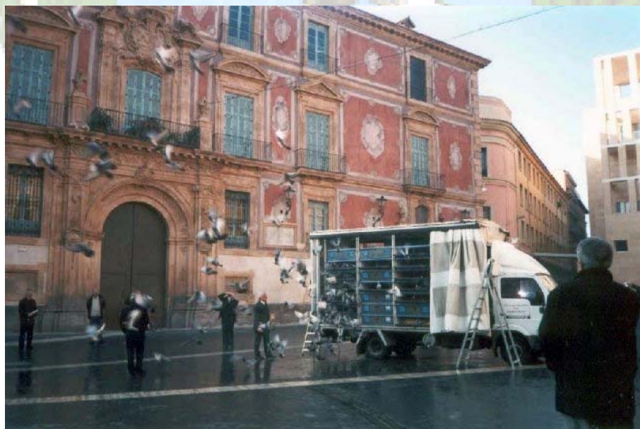
Suelta de Palomas en la plaza de la catedral de Murcia, con motivo de la Exposición Nacional de 2002.

7º As Paloma Nacional de Larga Distancia.