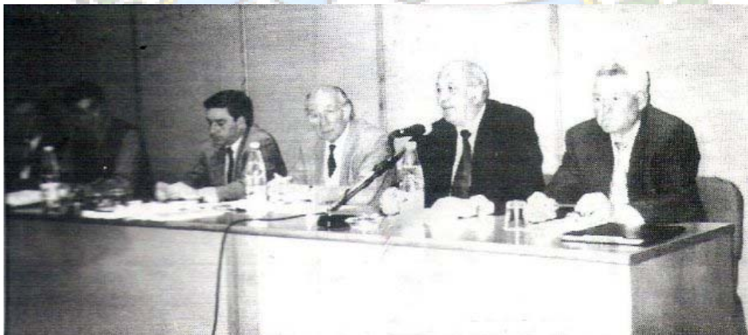
Mesa del Congreso de la Federación Portuguesa de Colomofilia celebrado el 21-02-1999 en Coímbra, y en él se trató de la Organización de la Suelta Casablanca 2000.

También me presenté voluntario para realizar como Presidente Organizador de la Suelta Internacional Casa Blanca 2000, en la que surgieron algunos problemas, pero que al final fue un éxito. Y así como Presidente Organizador del Concurso Ínter-Comunidades en 2004, el cuál no se ha repetido.