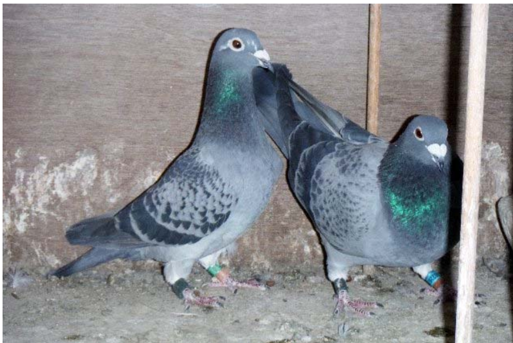
Pareja de "Ases". ¿Cómo serán sus hijos?

He sido, y sigo siendo, muy autodidacta y como te he comentado agradecer a aquellas personas que me han ayudado regalándome alguna paloma o pichón cuando empecé en este mundillo de la colombofilia.