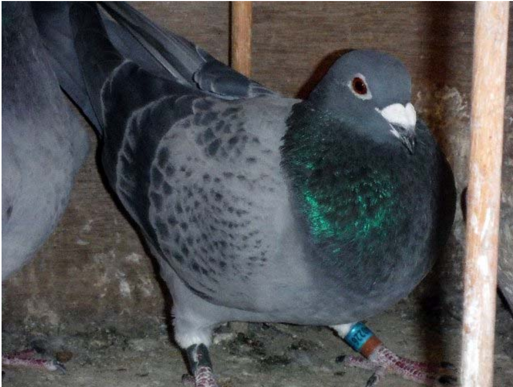
As Paloma Absoluta 2013. Macho azul jaspeado anilla 11-40226.