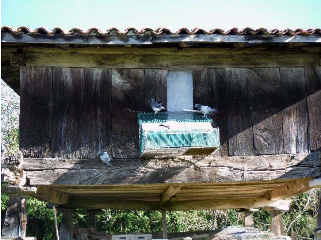
Palomar de reproducción de Ginés (hórreo).

¿Te propones algún objetivo al inicio de una campaña deportiva, o te los vas marcando con el discurrir de los campeonatos?