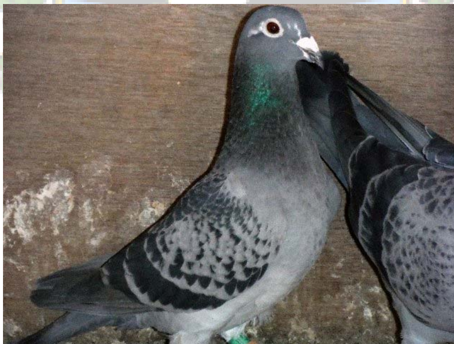
As Fondo/Gran fondo 2013, Hembra rodada 10-71815.